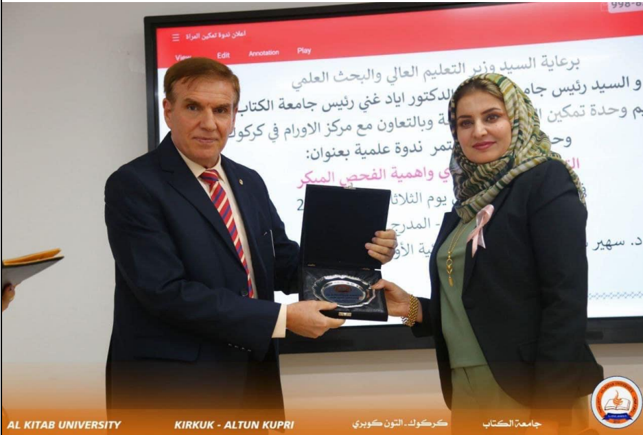
AL KITAB UNIVERSITY