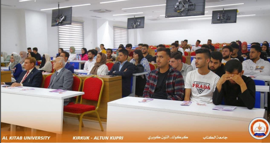
AL KITAB UNIVERSITY