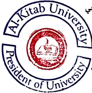
رئيس جامعة الكتاب