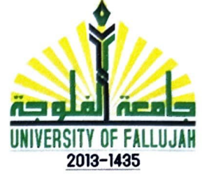
الطرف الثاني رئيس جامعة الكتاب